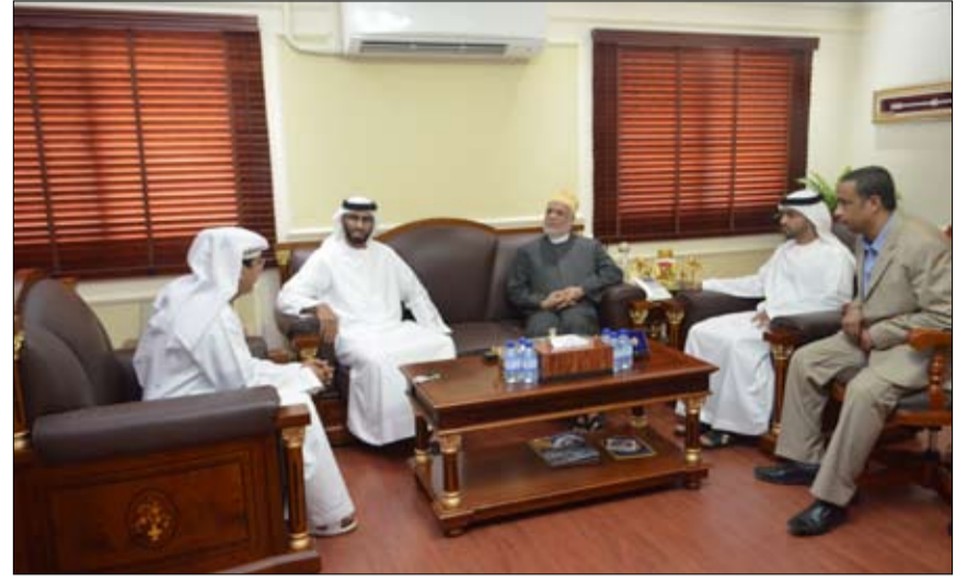
•• رأس الخيمة - الفجر:

استقبل الشيخ محمد بن كايد القاسمي رئيس دائرة التنمية الاقتصادية في رأس الخيمة صباح الثلاثاء الماضي، في مقر الدائرة، الرئيس السابق لجمهورية الاتحاد القمري فخامة أحمد عبدالله سامبي بحضور مدير دائرة التنمية الاقتصادية