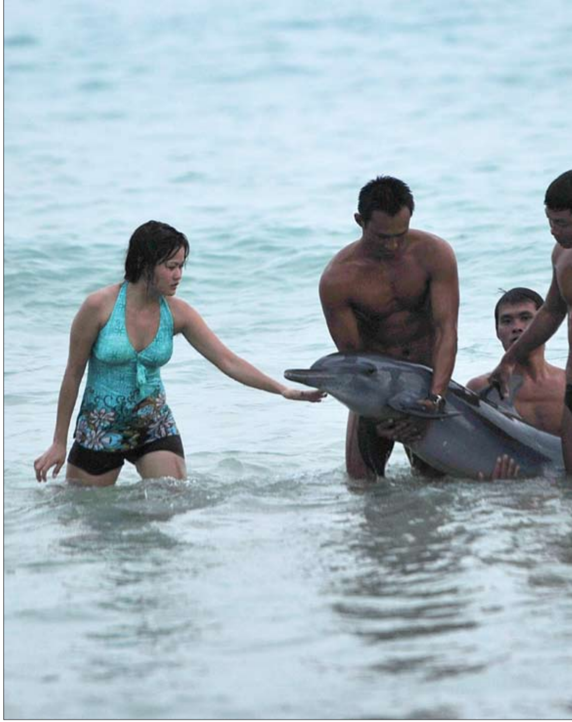
سياح يلتقطون صورة مع دلفين تقطعت به السبل على شاطئ في سانبا بمقاطعة هاينان الصينية.

وأكد الباحثون أن كبار السن الذين يستخدمون تلك العقاقير معرضين للإصابة بمرض السكر بغض النظر عن نوع العقار أو جرعته، وذلك بسبب تورطها في إحداث خلل بعملية إفراز هرمون الأنسولين لافتين أن وصف الطبيب للعقار سيعتمد على تقديره للأموور وحسب حاله المريض وخاصة أن فوائده في الحد من أمراض القلب تفوق المخاطر المحتملة في تحفيز الإصابة بمرض السكر.